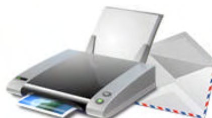
Impression papier et envoi mail