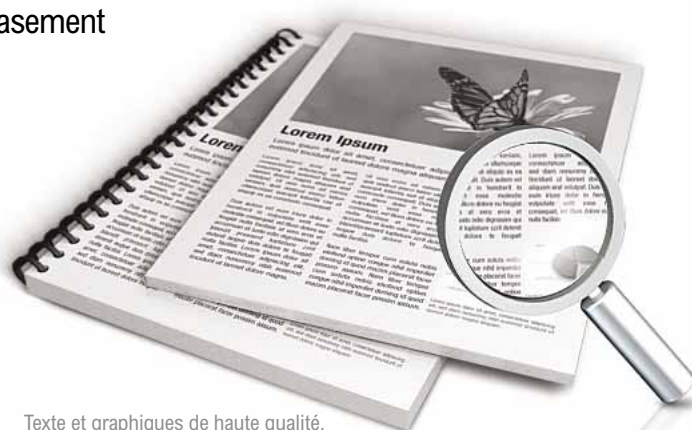
Texte et graphiques de haute qualité.