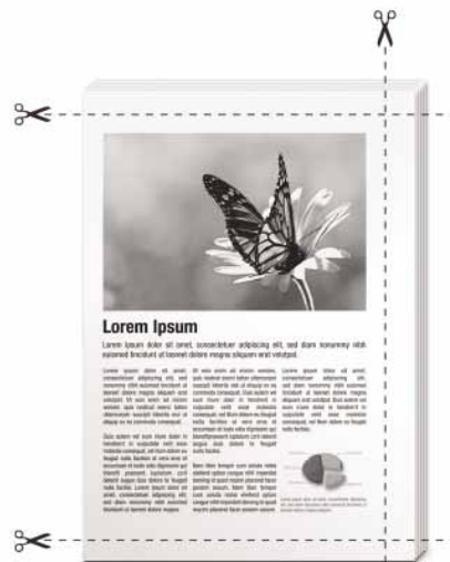
Massicotage 3 côtés (ajustable).