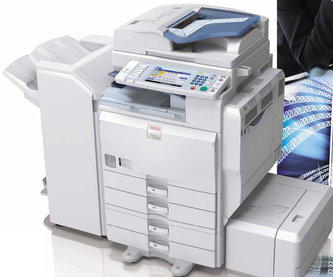
Plate-forme documentaire haute performance au service de votre communication